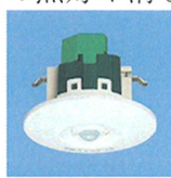
熱線センサー付自動スイッチ