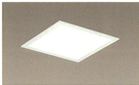
LED ベース照明 (売場)

売場・バックヤードの基本照明に、消費電力が少ない LED 照明を導入しています。 売場の基本照明は、必要に応じた照度を設定することにより電力消費をコントロールします。