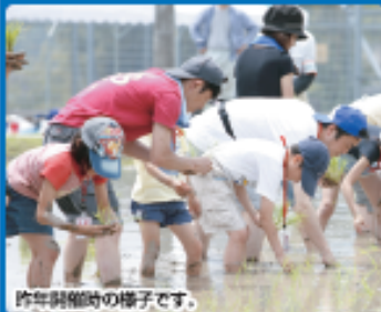
昨年開催時の様子です。