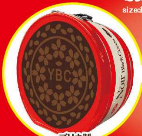
フリキ製 ノアールオリジナルBOX size:約W250×H250×D120mm