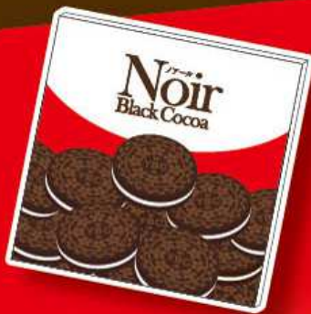
ノアール オリジナルメモ帳 size:約W95×H95mm