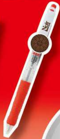
ノアール ボールペン size:約W20×H149mm