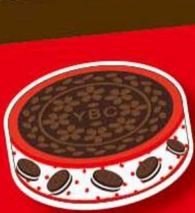
ノアール マスキングテープ size:約15mm×5m