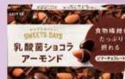
乳酸菌チョコ アーモンド