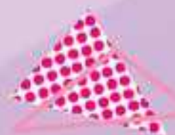
スイートデイズ乳酸菌チョコ (チョコレートのみ・アーモンド)