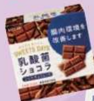
乳酸菌チョコ アーモンド