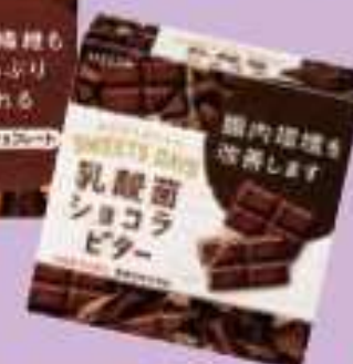
乳酸菌 チョコ ビター