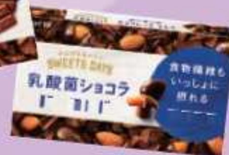
乳酸菌チョコ アーモンド