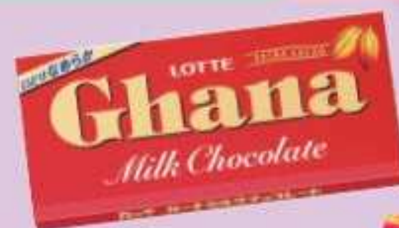
ガーナミルクチョコレート