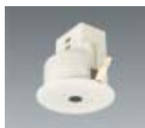
照度センサ付自動スイッチ