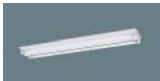
熱線センサ付自動スイッチ

バックヤードの通路・従業員用更衣室・休憩室の照明には、人を検知して自動で点灯・消灯できる人感センサースイッチを導入し、不在時の点灯や消し忘れなど無駄な電力消費を抑えます。