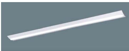
LED ベース照明（売場・バックヤード）

売場・バックヤードの基本照明に、消費電力が少ない LED 照明を導入します。 売場の基本照明は、必要に応じた照度を設定することにより電力消費をコントロールします。