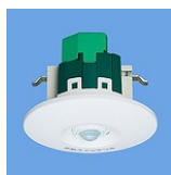
熱線センサー式自動スイッチ